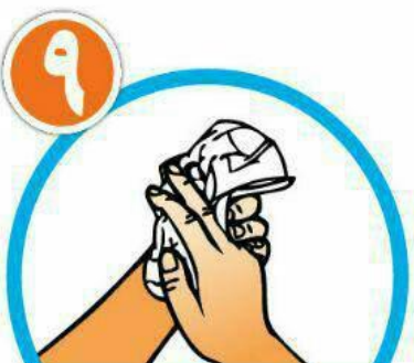
دست ها را با دستمال خشک کنید.