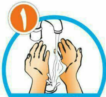
دست ها را خیس کرده و بعد آن ها را صابونی کنید.

پروتکل بهداشتی مبارزه با کووید-۱۹ (کرونا ویروس) فاصله گذاری و الزامات سلامت محیط و کار در شهر بازی ها و مراکز تفریحی آبی