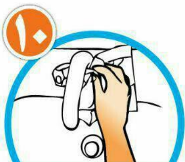
با همان دستمال شیر آب را ببندید و دستمال را در سطل زباله بیاندازید.