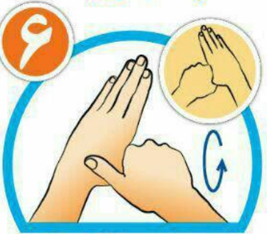
شست ها را جداگانه و دقیق بشویید.