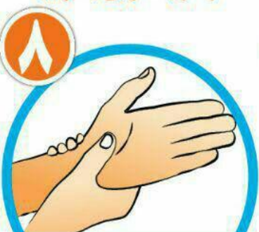
دور مچ هر دو دست را بشویید.