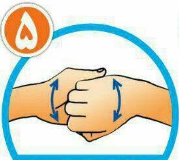
نوک انگشتان را درهم گره کرده و به خوبی بشویید.