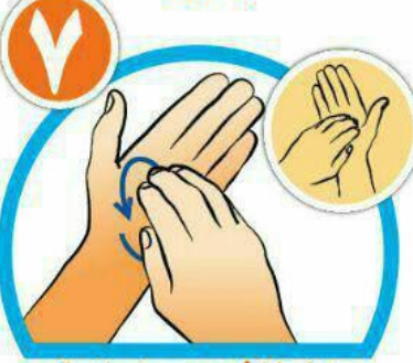
خطوط کف دست را با نوک انگشتان بشویید.